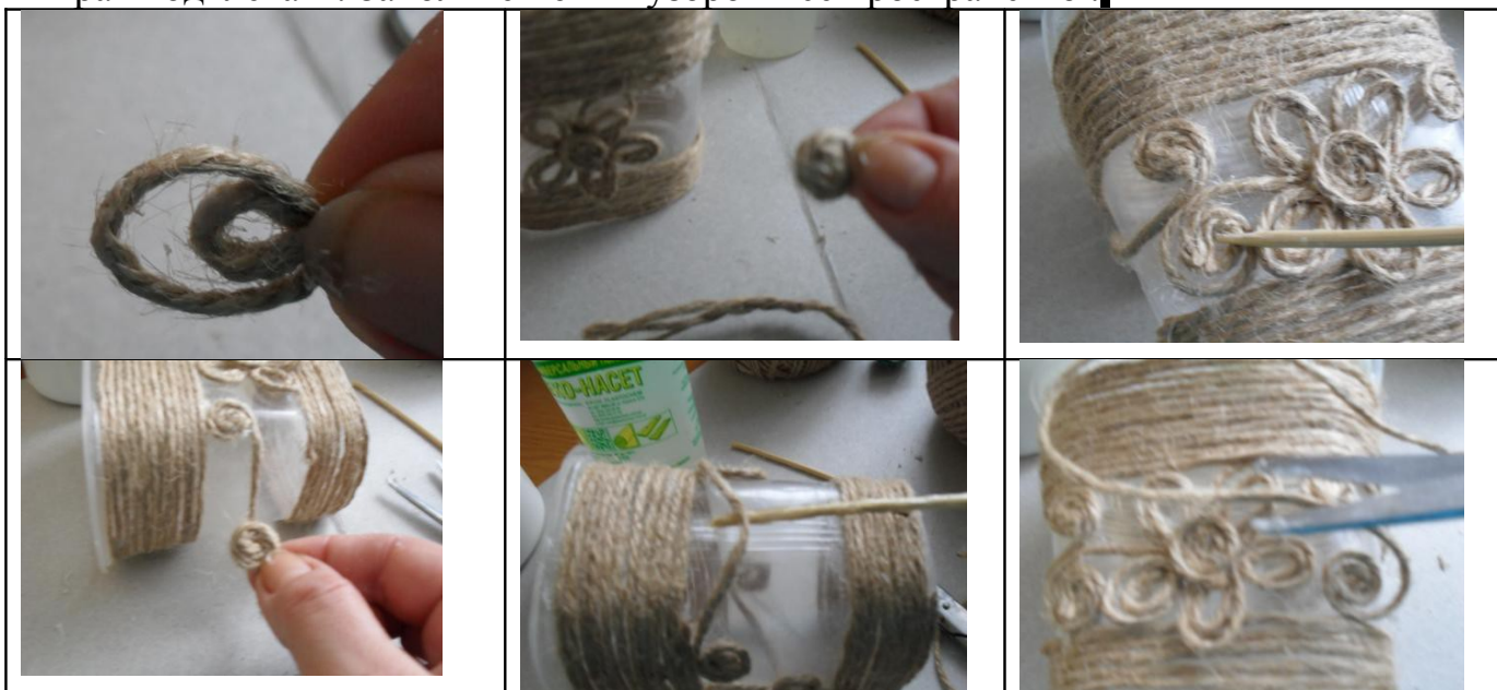
Фото 4. Теперь начинаем заклеивать дно баночки. Смазываем дно клеем Титан и аккуратно заклеиваем дно спиралькой (от краев к центру).

3. Незаполненное пространство баночки будем украшать в технике «Джутовая филигрань» Для этого будем использовать растительный орнамент. ВАЖНО: детали клеим на клей Титан! Из нити делаем лепестки цветочка (5 шт.) и наклеиваем их на баночку. В центр цветка приклеиваем кружочек. От цветочка в разные стороны пускаем листики (петельки) и завитки. Желательно поточнее и плотнее подгонять детальки друг к другу. ВАЖНО: обрезать нити надо наискосок и края подклевать. Заполняем этим узором все пространство .